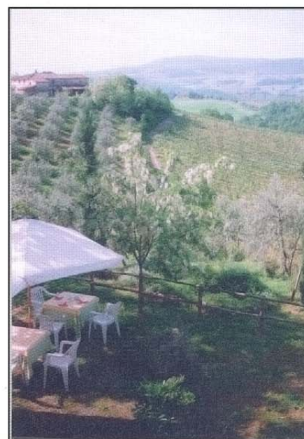
Zimmer mit Aussicht