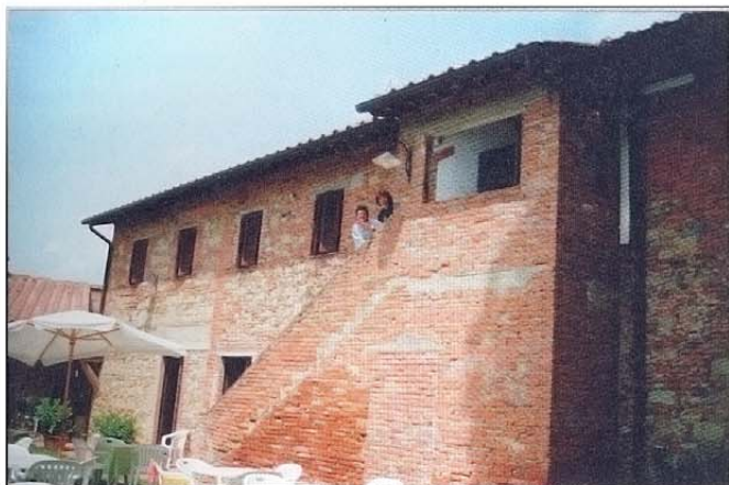
Locanda dell' Agresto – Ansicht von der Terrasse